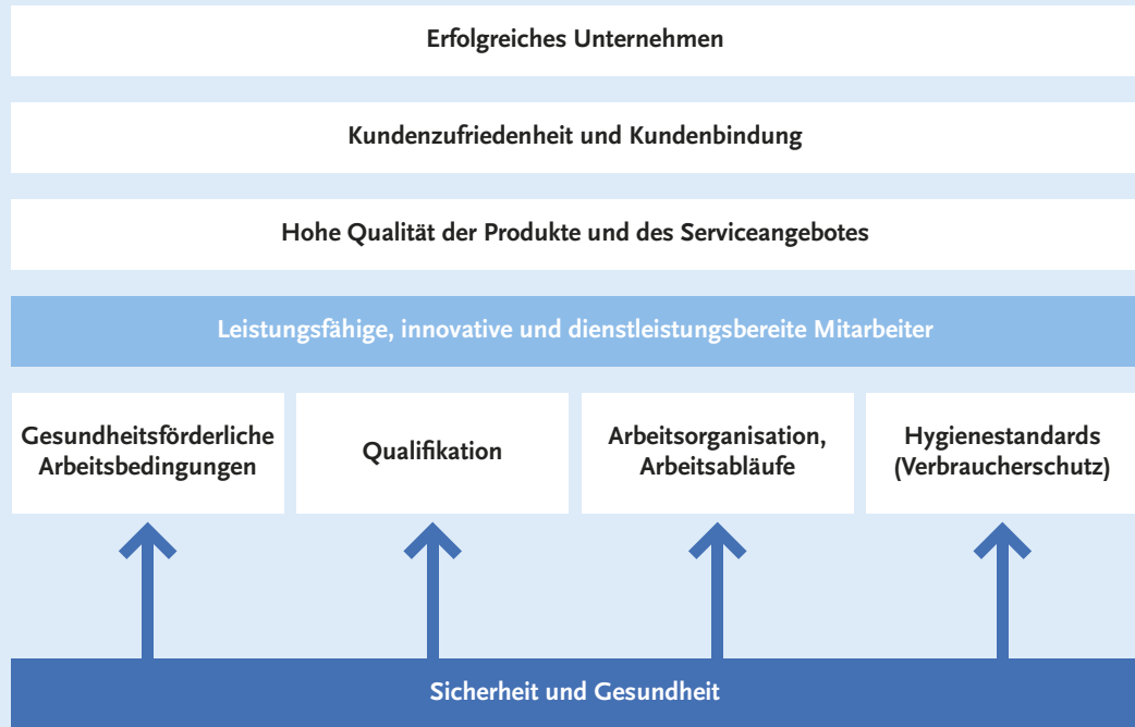
Abb. 1 Sicherheit und Gesundheit bilden die Basis für den unternehmerischen Erfolg (Quelle: Tagungsdokumentation ›Neue Zielgruppen für den Arbeits- und Gesundheitsschutz – Existenzgründer und ihr Beratungsumfeld‹, Workshop vom 26.10.2004 in Berlin)

stellung zu einer erfolgreichen Beratung gibt Ihnen die vorliegende Broschüre. Wir möchten Sie damit anregen, neue Elemente in die Beratungsleistung aufzunehmen und weiter zu entwickeln. So gibt Ihnen die Broschüre eine Einführung zum Themenkomplex Sicherheit und Gesundheit, liefert Ihnen